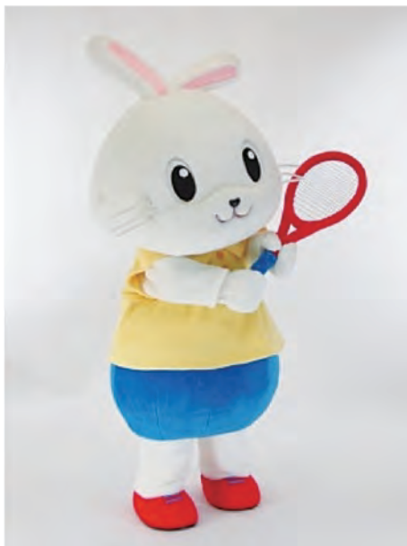
ソフトテニス マスコットキャラクター 「そふていー」